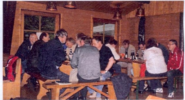
Bis in die späten Abendstunden wurde geplaudert

Wir freuen uns darauf, Sie auch im nächsten Jahr am ersten Wochenende der hessischen Sommerferien zum großen Ehemaligentreffen einzuladen.