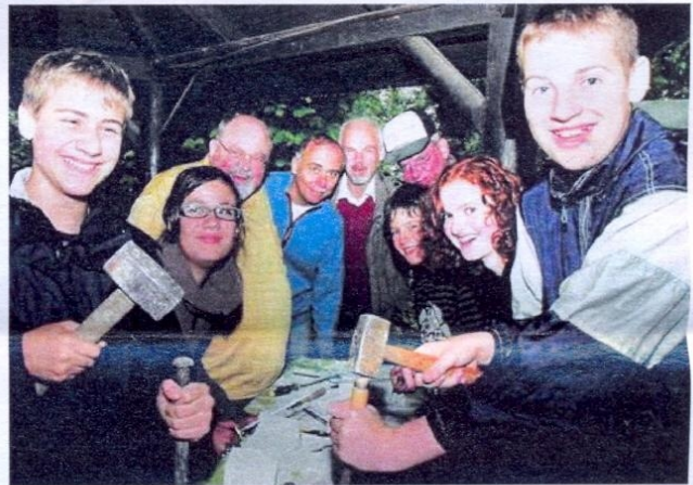
Jung und Alt hatten viel Spaß